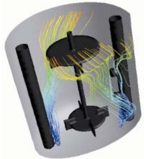
ディスクタービン翼での気泡の動き