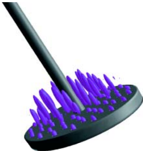
孔から放出されたジェットを等速度面で表示

Kumar M. Dhanasekharan, Srinivasa L. Mohan (Fluent Inc.)